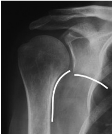
Figura 1. Disfunción de superioridad según la línea omohumeral.