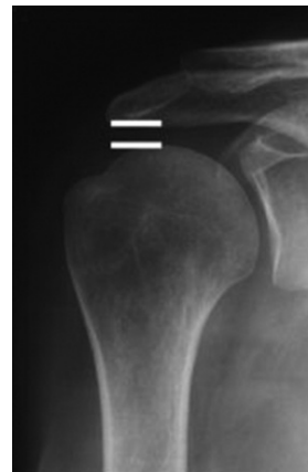
Figura 4. Medición del espacio subacromial.

borde externo de la escápula, se diagnostica como disfunción de superioridad de la cabeza del húmero (fig. 1).