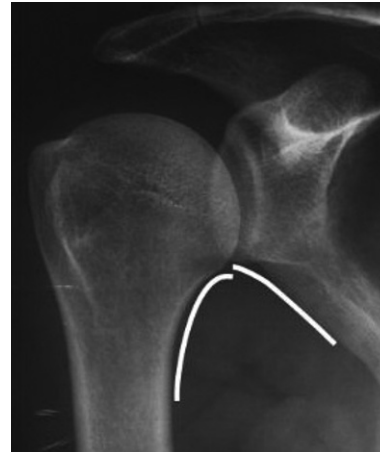
Figura 3. Disfunción de superioridad según la línea omohumeral.