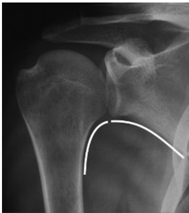
Figura 2. Ausencia de disfunción de la cabeza humeral en el plano frontal según la línea omohumeral.